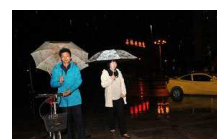
云南石林喜降甘霖