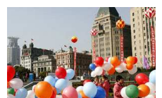
上海外滩全新亮相