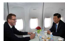
习近平会见芬兰总理万哈宁