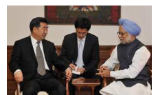
回良玉会见印度总理