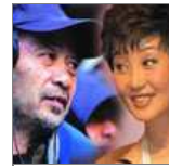
揭田壮壮徐帆情史