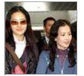
揭秘生父离婚内幕