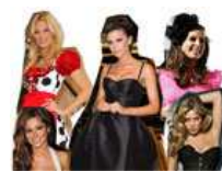
球星太太们的奢华之旅