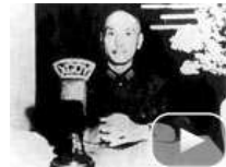
蒋介石为何十年后对日宣战