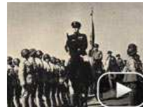
孙立人亲上阵与林彪对决