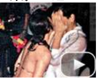
明星糜烂派对豪放令人咋舌