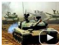
盘点：从军演看解放军军力