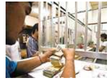
苏北地下钱庄利高银行两倍