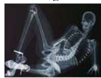
X光透视下的“性感”女骷髅