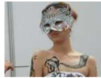
西安性博会上的人体彩绘