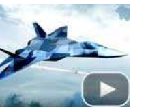
俄罗斯尖端武器所剩无几？