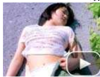
的哥坐视少女车内遭强奸