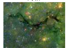
神秘蛇状星云酷似宇宙大裂缝