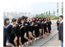
露腿毕业照是堕落还是新潮