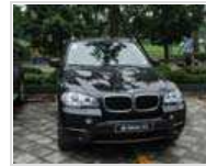
宝马三年坏俩发动机