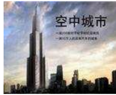
世界十大最高楼排行榜