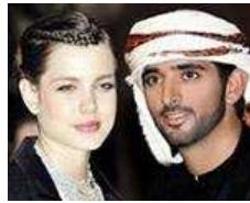
全球最性感王室成员