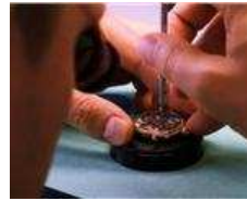
瑞士百达翡丽手表制造过程