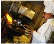
全球收入最高的职业