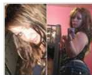
美妇与未成年儿子乱伦