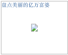
盘点美丽的亿万富婆