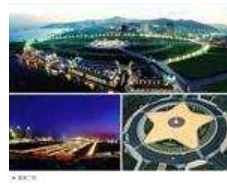
中国十大畸形城市