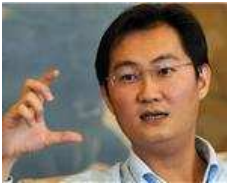
中国最有钱的十大富豪家族