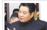
揭一个高官从发迹到落马