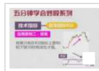
RSI震荡指标何时出现背 离才算真正有效?