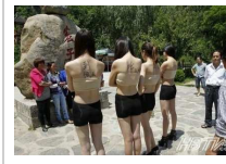
4名女子为公益景区脱衣