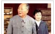
揭为毛泽东服务秘密小组