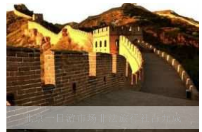
北京一日游市场非法旅行社占九成